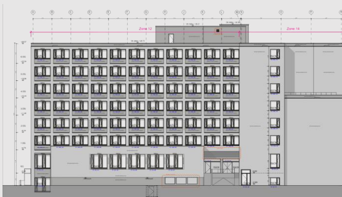
Planung Ansicht Nord-West